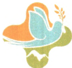
RSUD KARTINI KARANGANYAR